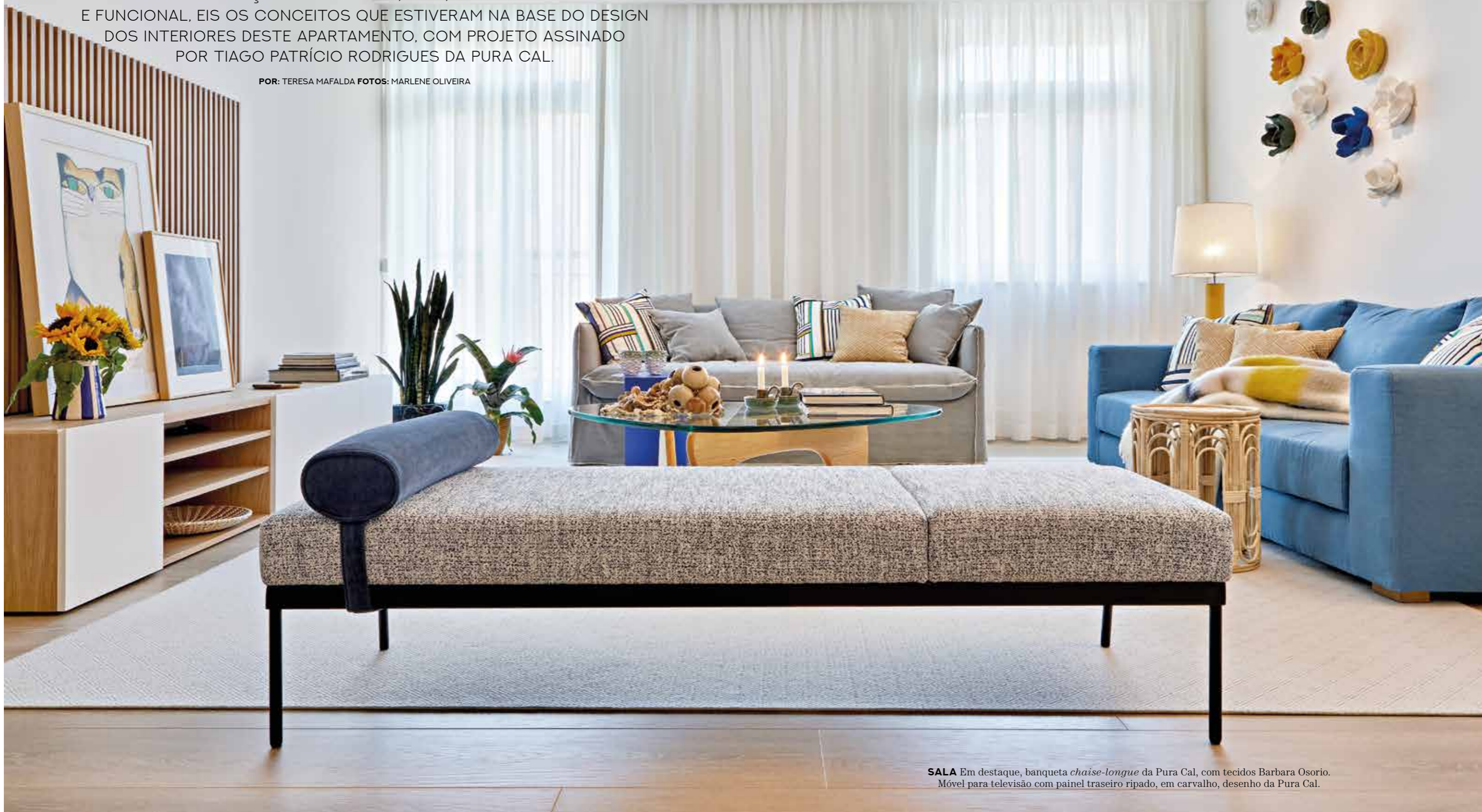
SALA Em destaque, banqueta chaise-longue da Pura Cal, com tecidos Barbara Osorio. Móvel para televisão com painel traseiro ripado, em carvalho, desenho da Pura Cal.

POR: TERESA MAFALDA