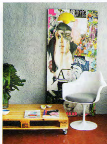
Cadeira DAW Charles Eames réplica 141,45€