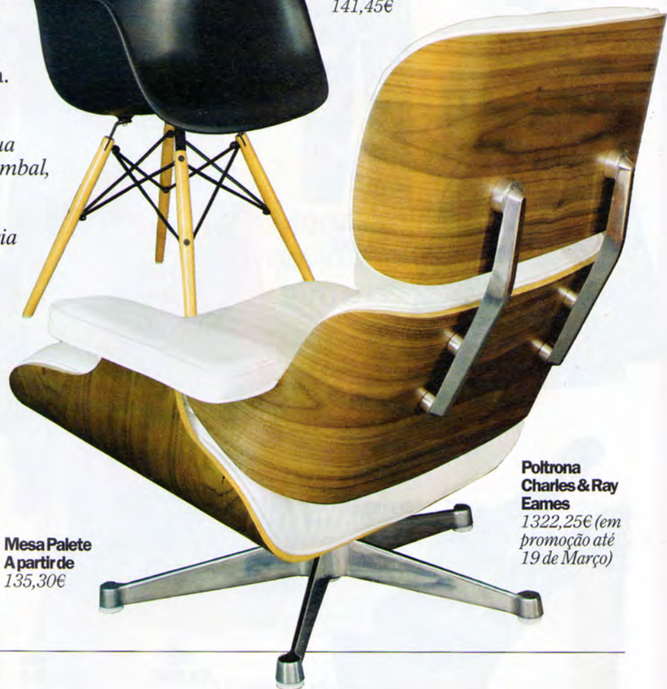
Poltrona Charles & Ray Eames 1322,25€ (em promoção até 19 de Março)